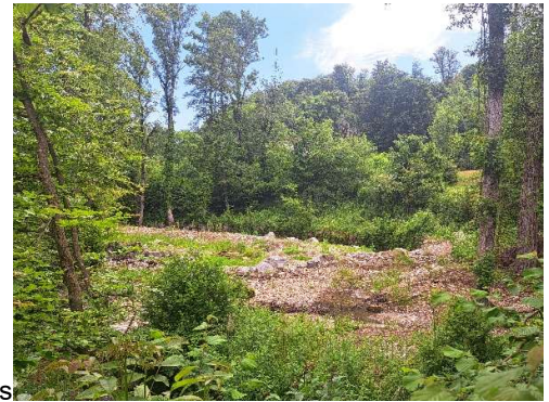
aménagements forestiers et milieu humides